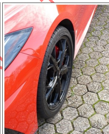
Distanzscheibe a. d. VA, 10 mm dick