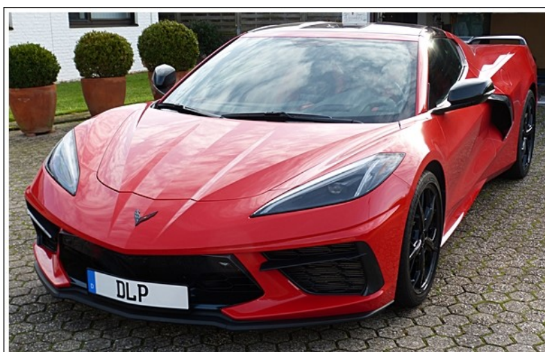
Distanzscheibe f. d. VA/ HA, 10 mm dick

Hier 2 Fotos mit der Spurverbreiterung mit 10 mm rundum. Ist auch unsere Empfehlung u. B. des Designs, der Kosten und der Variablen zu der TÜV- Abnahme und einem Rückbau mit den OEM- Felgen/ Reifen bzw. Umrüstung mit Fremdfelgen.